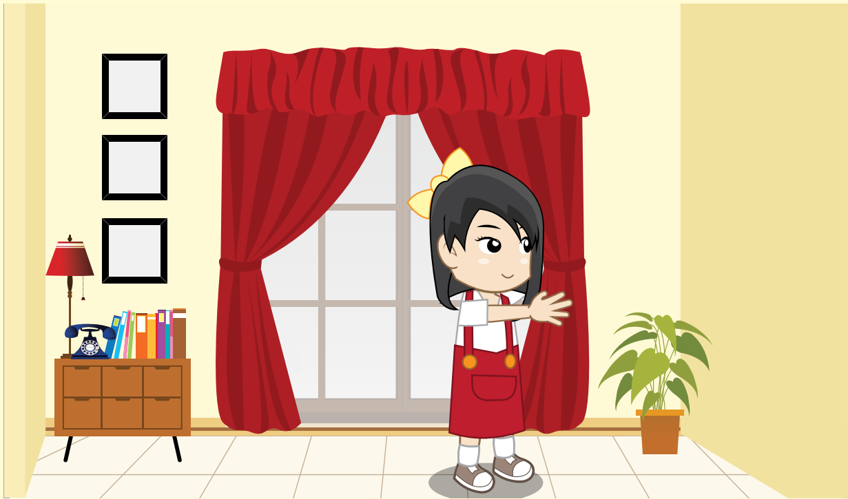
Gambar 7.3 Sikap lemah lembut dan penuh perhitungan

Tempat Ribut Perkelahian, Tinggalkan Jangan Didekati Kesesatan hal Keluar Jalur, Tinggalkan Jangan Terlibat