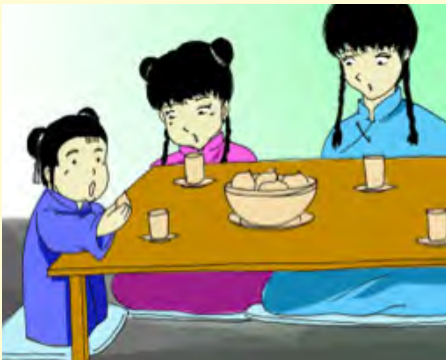
Gambar 7.8 Kasih sayang antarsaudara

Mereka membakar dupa yang amat harum, berlutut dan sujud sampai ke tanah, menyatakan syukur dan hormat kepada Tuhan. Inilah kegiatan religius terbesar setelah hari raya keagamaan orang Tionghoa: Imlek. Pada tanggal 8 menjelang tanggal 9 bulan pertama Imlek.