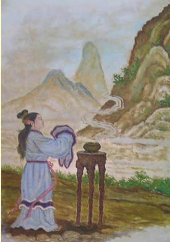
Gambar 3.2 Ibunda Yan Zheng Zai bersembahyang di bukit Ni

Menjelang kelahiran Nabi Kongzi ada 3 (tiga) tanda yang menjadi Gan Sheng , yaitu