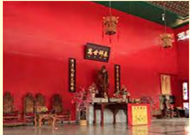
Gambar 6.4 Kongzi Miao Taman Mini Indonesia Indah.