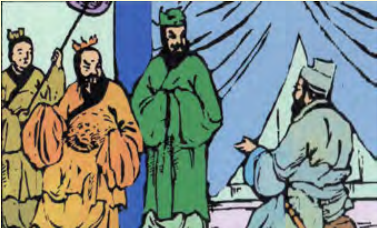
Gambar 4.3 Nabi Kongzi di negeri Wei

Kepada nabi yang tidak mau dekat kepadanya, Wang Sun Jia pernah menyindir, “Apa maksud peri-bahasa, daripada bermuka-muka kepada Malaikat Ao (Malaikat ruang Barat Daya rumah), lebih baik bermuka-muka kepada Malaikat Zao (Malaikat Dapur) itu?” Dengan tegas, Nabi Kongzi bersabda, “Itu tidak benar! Siapa berbuat dosa kepada Tuhan Yang Maha Esa, tiada tempat lain ia dapat meminta doa” (Lunyu. III: 13).