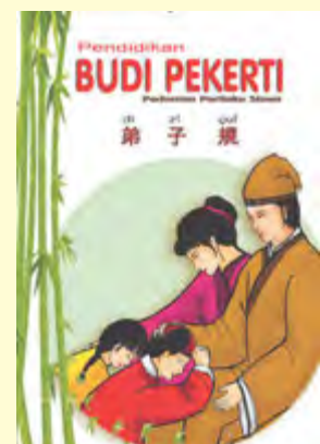
Gambar 7.1 Buku Pendidikan Budi Pekerti Di Zi Gui

Sebagai sistem pendidikan ‘Budi Pekerti’, Di Zi Gui sangat universal dan dikenal oleh masyarakat luas. Tidak hanya digunakan oleh kalangan internal umat Khonghucu tetapi dapat juga digunakan oleh