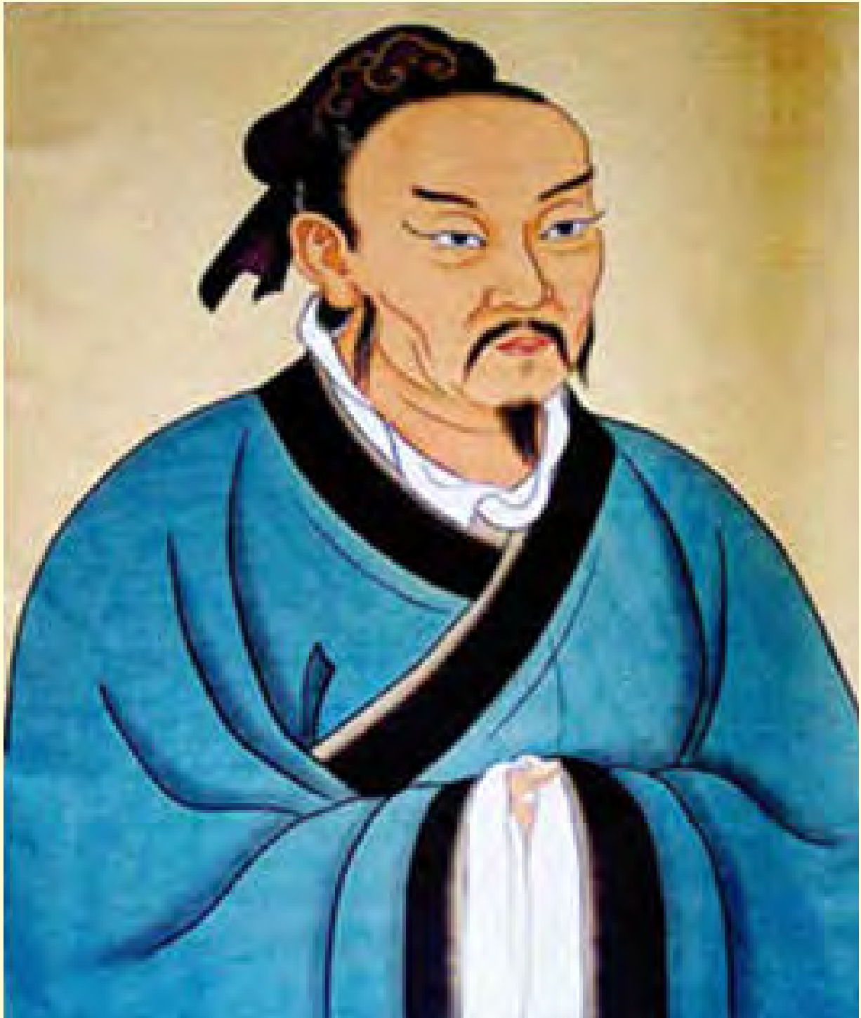
Gambar 4.7 Mengzi atau Mencius (tokoh besar kedua setelah Nabi Kongzi)