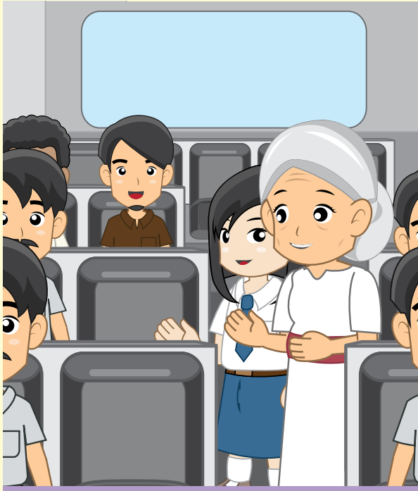
Gambar 7.5 Mendahulukan yang lebih tua