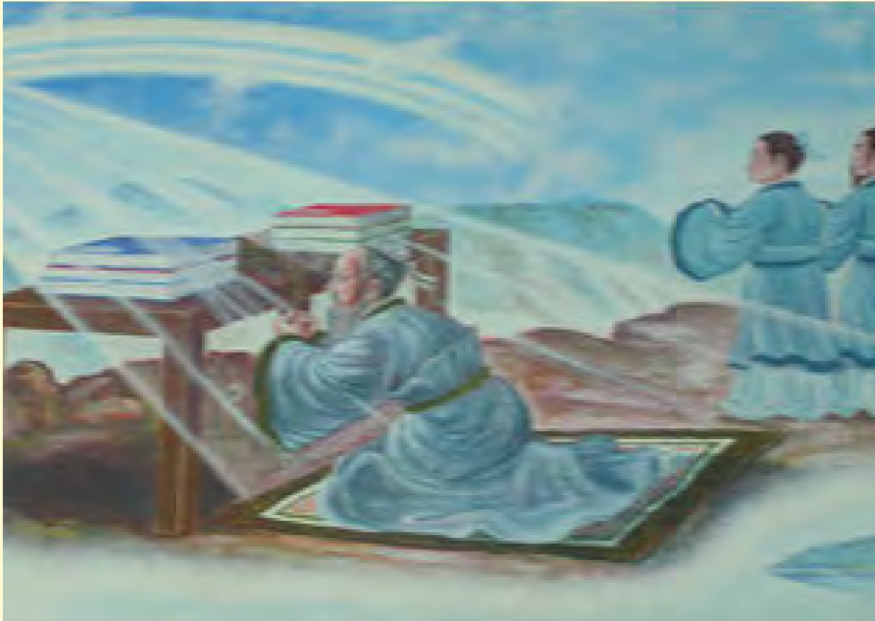
Gambar 4.5 Nabi Kongzi menyelesaikan penyusunan kitab-kitab

runtuhlah, balok-balok patah. Kini selesailah riwayat sang budiman.” Bila menyimak sabda terakhir, tampak jelas Nabi Kongzi menyadari tugas sucinya. Nabi Kongzi khawatir ajarannya tidak ada yang meneruskan. Karena murid terpadai yang diharapkan telah tiada. Cita-cita nabi mewujudkan Keharmonisan Agung, sebuah kehidupan ideal selaras dengan Jalan Suci, khawatir tidak ada yang melanjutkan.