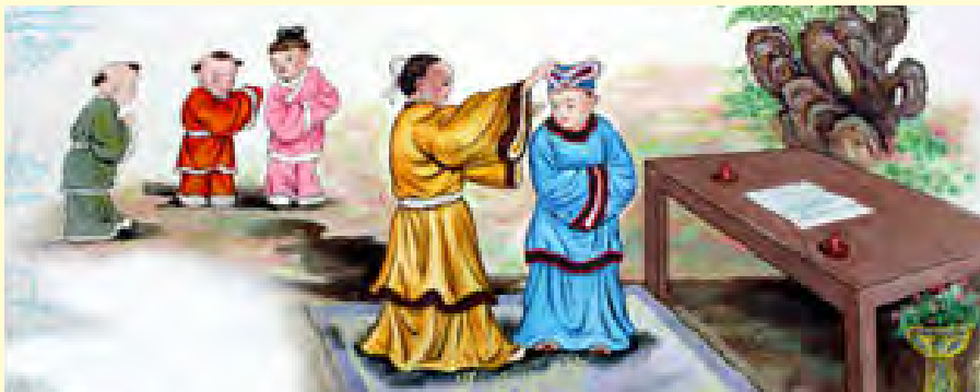
Gambar 3.5 Nabi Kongzi kecil sedang memimpin sembahyang dalam permainan dengan teman-teman sebayanya

Nabi Kongzi ketika berusia tujuh belas tahun terpaksa meninggalkan bangku sekolah untuk bekerja demi meringankan beban ibunya Beliau, Yan Zheng Zai. Ketika berusia sembilan belas tahun Beliau menikah dengan Jian Guan Si , seorang gadis dari Negeri Song. Pernikahan Beliau dilaksanakan secara sederhana, dengan suasana rohani yang suci dan khidmat, disucikan dan diteguhkan dengan melakukan ibadah kepada Tuhan Yang Maha Besar dan kepada arwah leluhur.