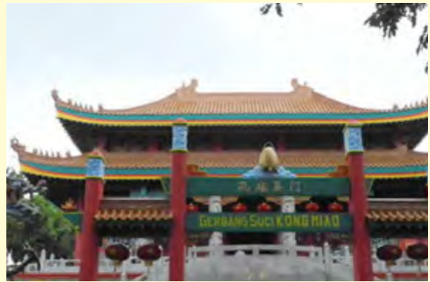
Gambar 6.2 Kongzi Miao Taman Mini Indonesia Indah.