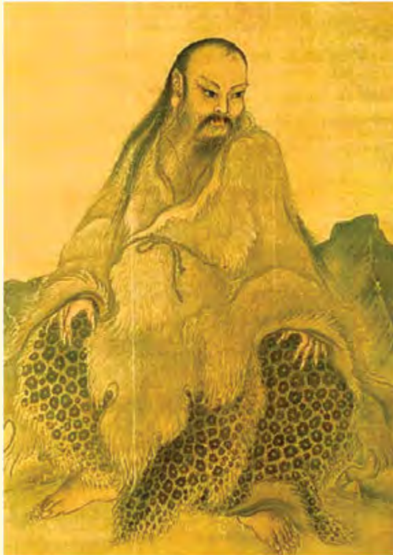
Gambar 2.1 Nabi Purba Fu Xi (2953 - 2838 SM.)

Ditulis dalam Kitab Tiga Makam (San Fen). Beliaulah yang pertama mengajarkan upacara pemakaman jenazah (Tu Zang), di mana sebelumnya dikenal Niao Zang (jenazah dibiarkan disantap burung), Lin Zang (jenazah diletakkan dibuang di hutan), Shui Zang (jenazah di hanyutkan ke sungai/laut), Huo Zang (jenazah dibakar/diperabukan).