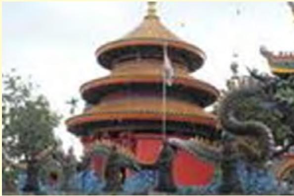
Gambar 6.1 Tian Tan tempat sembahyang kepada Tian yang berada di kompleks Kongmiao Taman Mini Indonesia Indah