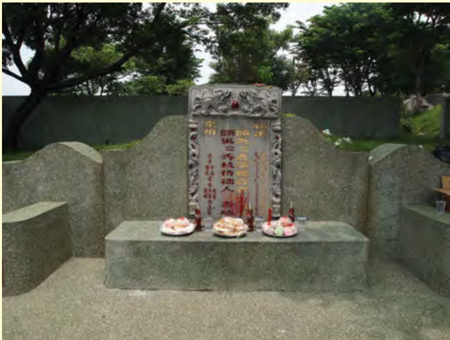
Gambar 1.2 Bersembahyang mendoakan arwah leluhur yang telah meninggal pada hari Qing Ming

“Dengan ilmu pengetahuan hidup akan terasa lebih mudah. Dengan seni hidup akan terasa lebih indah, dan dengan agama hidup akan terasa lebih terarah.” (H.A. Mukti Ali)