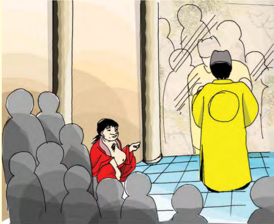
Gambar 5.2 Hati nurani manusia ibarat cermin yang akan memancar apa yang ada di dalam diri.

Apa yang terjadi selanjutnya? Wow! Seketika tabir terbuka, seluruh keindahan lukisan para seniman Romawi terpantul pula di dinding kelompok seniman Zhongguo. Ternyata pantulan 'lukisan' di dinding para seniman Zhongguo yang jernih laksana cermin raksasa, nampak lebih indah dan cemerlang. Bahkan wajah baginda, permaisuri dan para bangsawan kerajaan yang sedang berada tepat di depan dinding itu pun, ikut terlihat di tengah 'pantulan' lukisan itu.