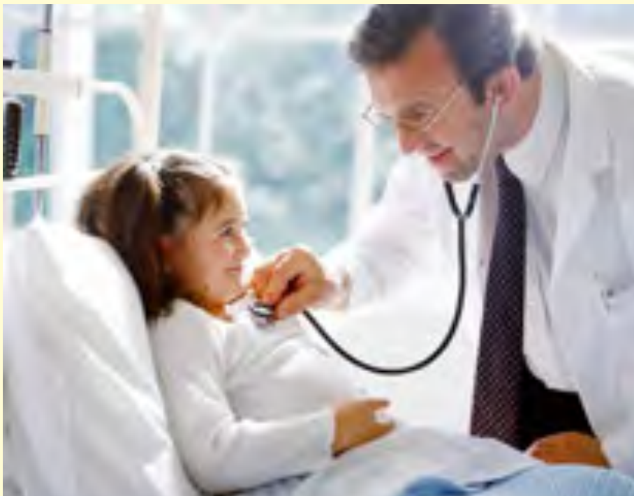
Gambar 4.1 Dokter sedang menangani masalah kesehatan anak

Setiap orang pasti pernah sakit. Nah, ketika sakit apa yang dilakukan oleh orang tua Anda? Benar, tentu saja membawa kepada dokter. Dokter adalah orang yang ahli untuk mengobati penyakit.