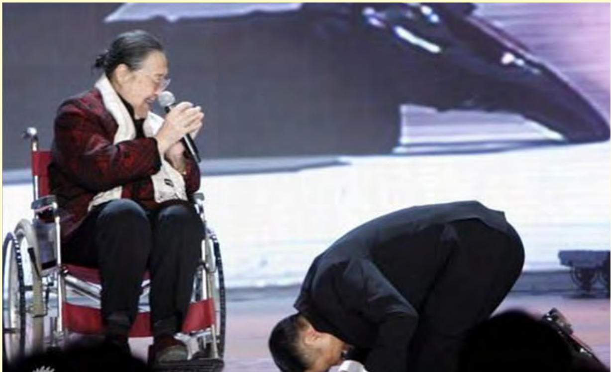
Gambar 3.1 Chao Yun-fat Pemeran Nabi Kongzi dalam Film Confucius Bersujud di Hadapan Keturunan Nabi Kongzi