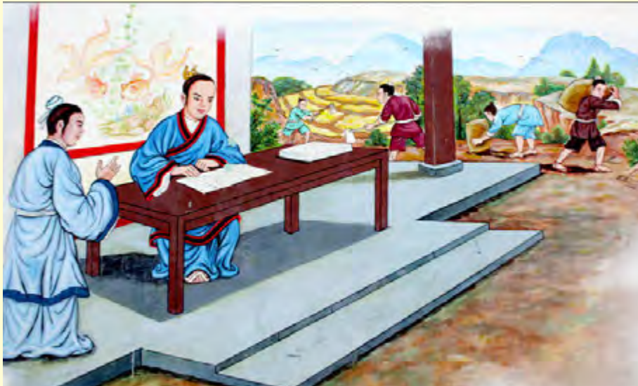
Gambar 3.7 Nabi Kongzi menjadi kepala dinas pertanian bangsawan Ji Sun

Keberhasilan Nabi di dalam membina dinas pertanian, menyebabkan Beliau diberi kepercayaan pula untuk membereskan dinas peternakan keluarga besar Ji Sun yang mengalami kekisruhan. Tugas baru ini pun diterima dengan gembira. Dengan penuh kesungguhan hati, Nabi berusaha membenahi berbagai masalah dalam dinas yang baru ini. Pembagian tempat penggembalaan diatur baik-baik, demikian pula persediaan makanan ternak untuk musim dingin sangat diperhatikan.