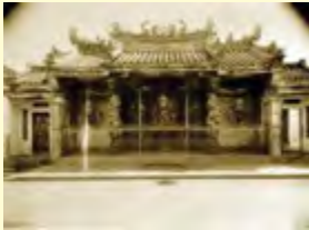
Gambar 2.6 Kelenteng Thian Ho Kiong di Makasar dibangun pada tahun 1688

Agama Khonghucu masuk ke Indonesia sebagai agama keluarga, para ahli Khonghucu datang bersama para pedagang dari Tiongkok.