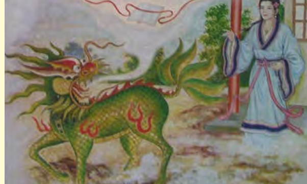
Gambar 3.3 Muncul Sang Qi Lin menyemburkan Kitab Batu Kumala (Yu Shu) di hadapan Ibunda Yan Zheng Zai