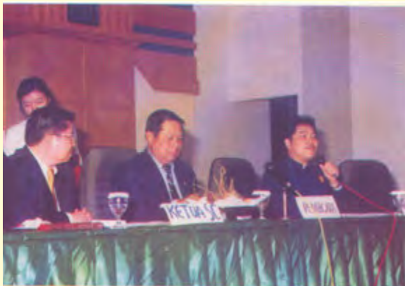
Gambar 2.7 Menkopolkam, Susilo Bambang Yudhoyono memberikan sambutan pengarahannya untuk sidang MUNAS MATAKIN XIV. Jakarta 2002

Pada tahun 2002, saat perayaan Hari Raya Imlek (Yin-li) 2553 Nasional yang ke tiga, Presiden Republik Indonesia Megawati Soekarno Putri telah menetapkan Tahun Baru Yin-li sebagai hari libur Nasional.