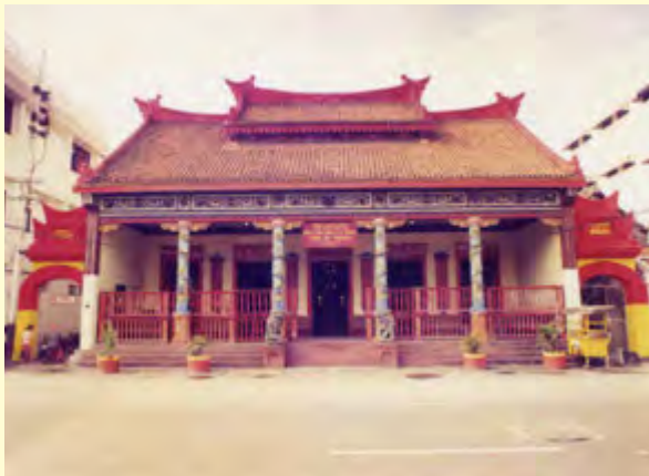
Gambar 6.3 Wen miao di jalan Kapasan Surabaya.

Rumah Abu leluhur, tempat umat Ru (agama Khonghucu) berdoa memuliakan arwah leluhurnya.