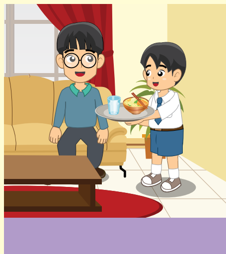
Gambar 7.7 Melayani paman seperti melayani ayah sendiri