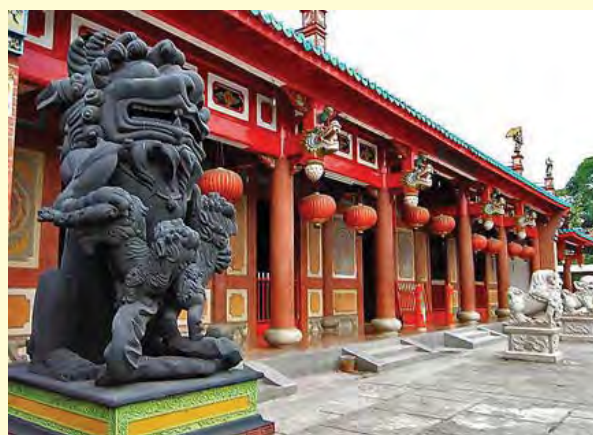
Gambar 6.5 Miao /Kelenteng di Kota Medan Sumatera Utara