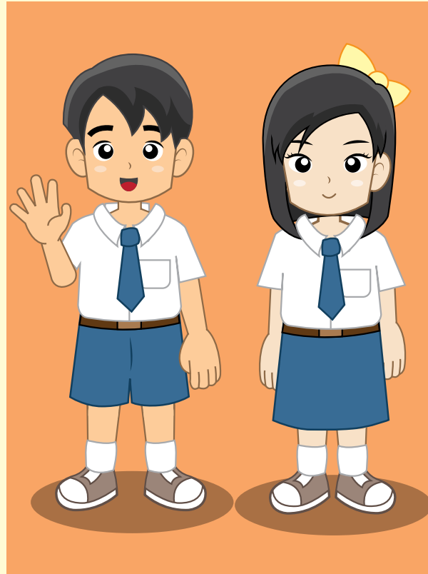
Gambar 7.2 Menjaga penampilan tetap rapih dan menarik