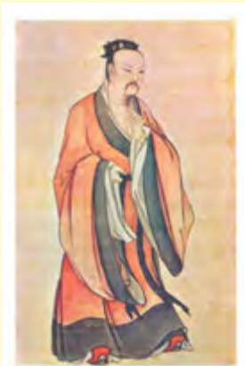
Gambar 2.4 Raja Suci Tang Yao (2357 - 2255 SM.)

Setelah Nabi Purba Fu Xi, Shen Nung, dan Huang Di, selanjutnya dikenal Raja Suci Tang Yao dan Yu Shun. Tang Yao berasal dari kaum Tao Tang, oleh karenanya orang sering menyebut Beliau Tang Yao. Beliau bergelar Fang Xun (yang besar pahalanya, cemerlang buah karyanya, dan hasil ciptanya).