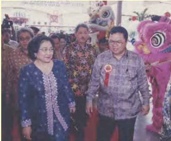
Gambar 2.9 Presiden RI ibu Megawati Soekarno Puteri bersama Ketua Umum MATAKIN pada perayaan Imlek 2553