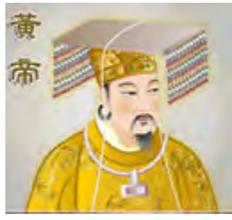
Gambar 2.3 Nabi Purba Huang Di (Bapak Ilmu Pengetahuan dan Raja Kebudayaan)

Huang Di memperoleh petunjuk Tuhan dalam mengemban tugas-tugasnya menetapkan hukum dan membimbing rakyatnya berbakti kepada Tuhan (beribadah) serta membina masyarakat dengan kebudayaan yang beradab, yang merupakan kodrat kemanusiaan, ditulis dalam Kitab Tiga Makam ( San Fen ), dan Kitab Huang Di Nei Jing . Beliau dikenal sebagai Bapak Ilmu Pengetahuan dan Kebudayaan , karena dengan para pembantunya Beliau membuat karya besar bagi umat manusia.