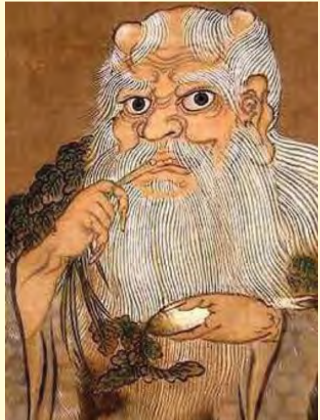
Gambar 2.2 Nabi Purba Shen Nong (Raja obat dan dewa pertanian)

Di samping itu, Beliau sangat berperan dalam mengajarkan kepada masyarakat zaman itu dalam hal pengolahan tanah serta pembudidayaan tanaman obat (herbal). Oleh karena itu Beliau mendapat julukan Dewa Pertanian dan Raja Obat .