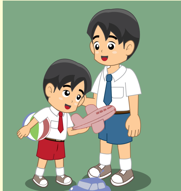
Gambar 7.4 Sikap kakak bersahabat, sikap adik berlaku hormat