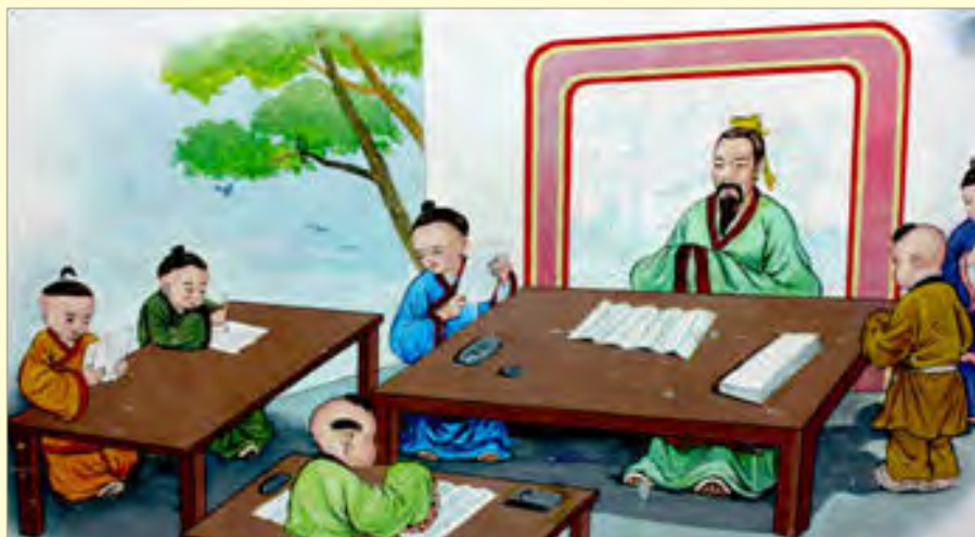
Gambar 3.6 Nabi Kongzi bersekolah pada perguruan Yan Ping Zhong

Pernikahan Nabi Kongzi dengan Jian Guan Si itu ternyata membawa karunia besar bagi keluarga Kong . Setahun kemudian lahirlah seorang putera laki-laki. Putera ini diberi nama Li alias Bo Yu. Nama Li yang berarti “Ikan Gurami” diberikan sebagai peringatan pemberian seekor ikan gurami oleh Lu Zhao Gong (Rajamuda Negeri Lu), tatkala tiba saat upacara genap satu bulan sang bayi. Kejadian ini menunjukkan bahwa dalam usia yang masih muda itu, Nabi Kongzi telah banyak dikenal masyarakat sekitarnya.