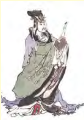
Gambar 2.5 Raja Suci Yu Shun (2255 SM. – 2205 SM.)

Raja Suci Shun lahir di Yao Xu, pindah ke Hu Hai dan wafat di Ming Tiao. Beliau orang Yi Timur orang menyebut Beliau Yu Shun. Mulanya diangkat sebagai pembantu Raja Yao kemudian diangkat sebagai menantu dan akhirnya atas dukungan rakyat mewarisi tahta kerajaan.