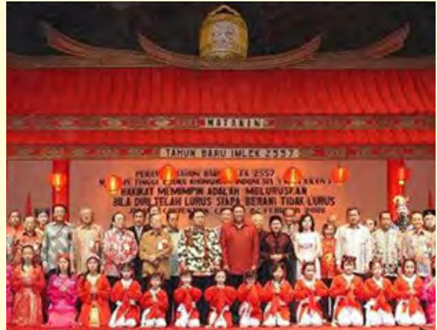
Gambar 2.10 Parayaan Imlek Nasional 2664