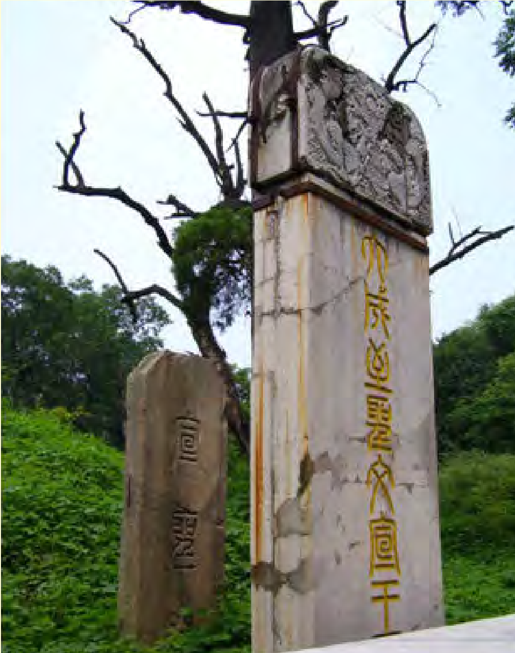
Gambar 4.6 Nabi Kongzi dimakamkan di kota Qu Fu, di dekat sungai Si Shui