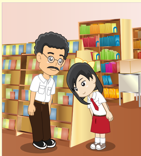
Gambar 7.6 Bertemu tetua di jalan segera memberi hormat

Melayani Para Paman, Bagaikan Melayani Ayah Melayani Para Sepupu, Bagaikan Melayani Kakak