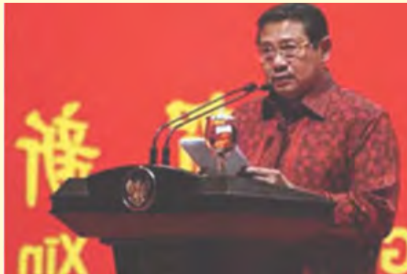
Gambar 2.11 Sambutan Presiden RI Susilo Bambang Yudhoyono pada perayaan Imlek Nasional 2664

Perayaan Imlek Nasional 2564 tahun 2013 diselenggarakan kembali dengan tema “Rasa Malu Besar Artinya Bagi Manusia”. Presiden Susilo Bambang Yudhoyono kembali berkenan hadir dan memberikan sambutannya.