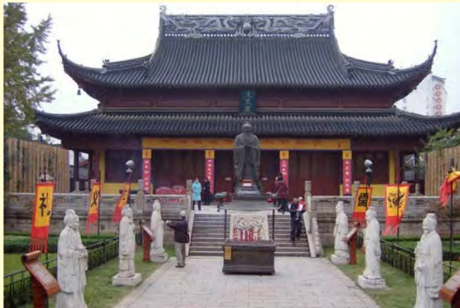
Gambar 6.6 Kong Miao (Miao Konghucu) di Nanjing China.

Sesuai dengan PP No 55 tahun 2007 tentang Pendidikan Agama dan Keagamaan Pasal 46 disebutkan bahwa Sekolah Minggu Khonghucu dan Diskusi Pendalaman Kitab Suci merupakan kegiatan belajar-mengajar nonformal yang dilaksanakan di Xueting, Litang, Miao dan Klenteng, yang dilaksanakan setiap minggu dan tanggal 1 serta 15 penanggalan lunar. Hal ini menunjukkan nilai-nilai utama kelenteng secara nilai agamis.