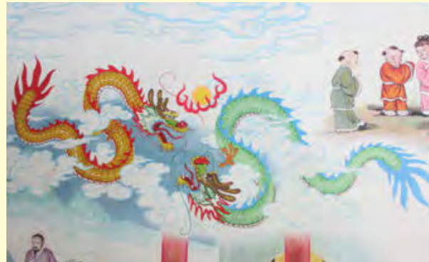
Gambar 3.4 Lima Malaikat tua dan dua ekor naga mengitari tempat kelahiran Nabi Kongzi