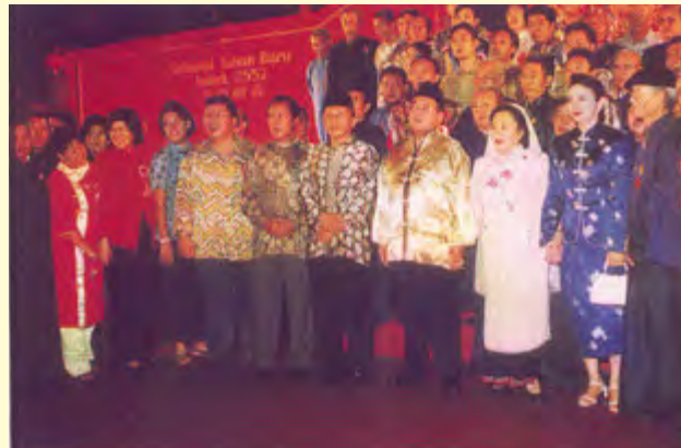
Gambar 2.8 K.H. Abdurrahman Wahid beserta Ibu, Bapak Amien Rais (Ketua MPR RI), Bapak Sutiyo beserta isteri, kembali berkenan hadir pada perayaan Imlek Nasional ke 2 di Istora Senayan Jakarta-2001

Selanjutnya Imlek secara Nasional diselenggarakan setiap tahun oleh Majelis Tinggi Agama Khonghucu Indonesia (MATAKIN), dan selalu dihadiri oleh Presiden dan pejabat negara lainnya. Antusias umat Khonghucu dari berbagai daerah di Indonesia untuk mengikuti perayaan Imlek Nasional ini tetap tinggi.