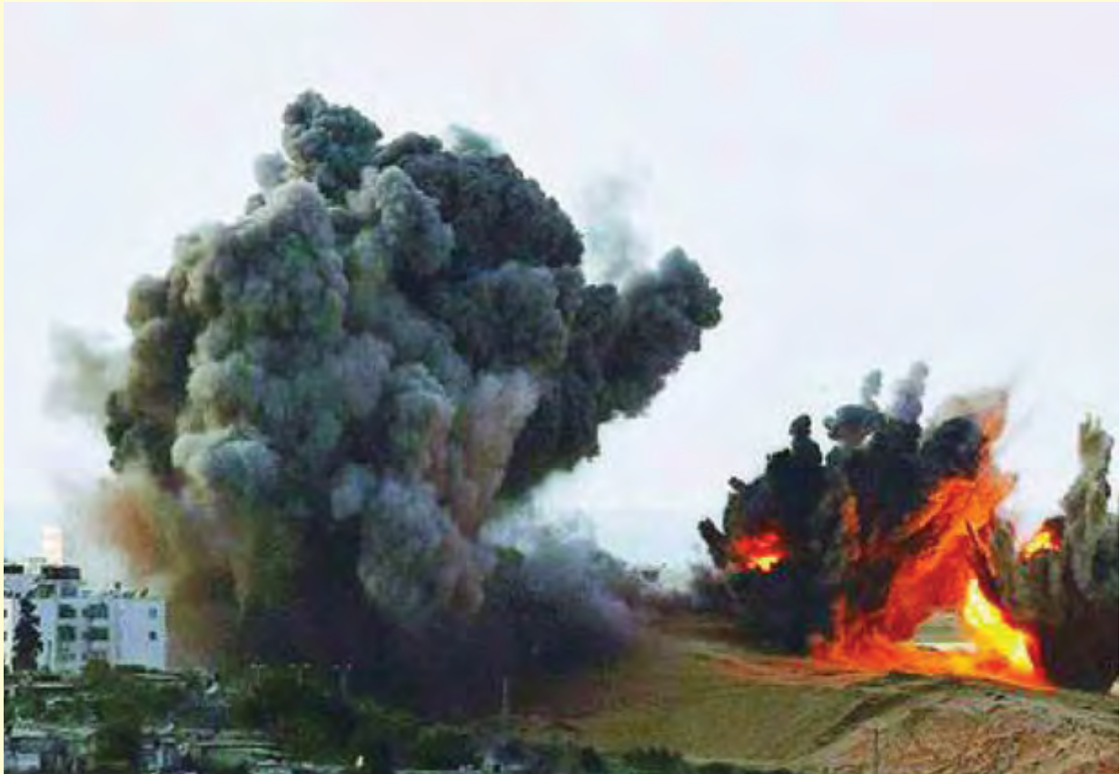
Gambar 1.1 Perang Israel Palestina yang berkepanjangan

Konflik, pertikaian dan peperangan juga terjadi dalam lingkup yang lebih kecil, dalam rumah tangga, dan dalam diri pribadi kita masing-masing. Nabi-nabi diturunkan ke dunia bukan pada saat dunia damai, tetapi justru pada saat dunia penuh konflik.