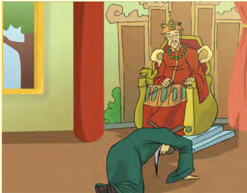
Gambar 1.3 Rasa berterima kasih kepada sesama dan bersyukur kepada Tuhan untuk setiap hal yang terjadi

Shi Gan Ji apa pun yang terjadi, selalu bersyukur , saat kita dalam kondisi maju dan sukses kita patut bersyukur, dan saat musibah datang pun kita tetap bersyukur. Dalam proses kehidupan ini, memang tidak selalu bisa berjalan mulus seperti yang kita harapkan. Kadang kita di hadapkan pada kenyataan hidup berupa kekhilafan, kegagalan, penipuan, fitnahan, penyakit, musibah, kebakaran, bencana alam, dan lain sebagainya.